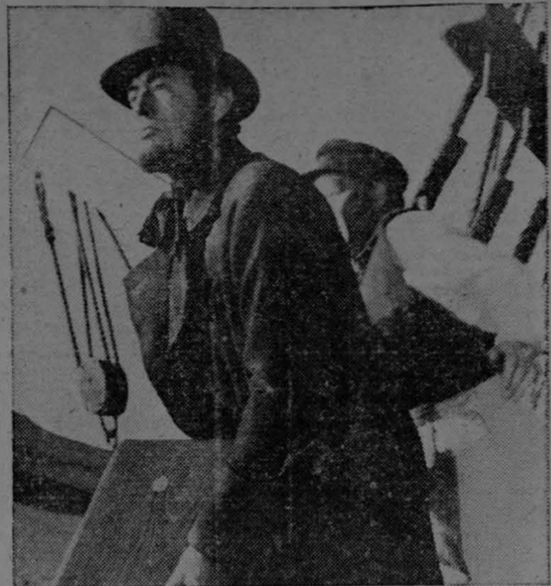
Gregory Peck, como capitán Ahab, en la película "Moby Dick", de Herman Melville