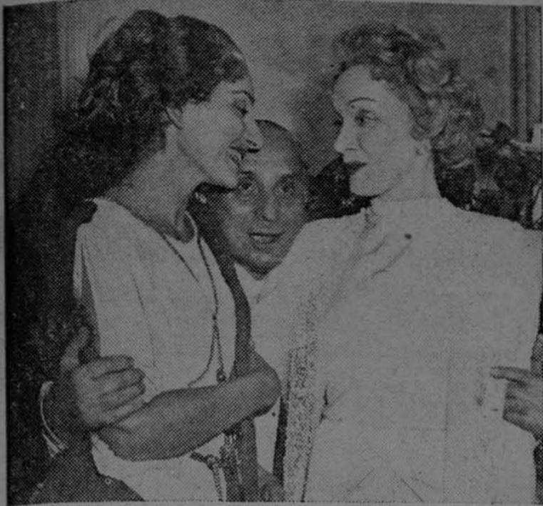
María Meneghini Callas, a la izquierda, el día de su debut en el Teatro Metropolitano de Opera de la ciudad de Nueva York, cuando recibía las felicitaciones de la actriz cinematográfica Marlene Dietrich. Entre ambas aparece el esposo de la diva, Batista Meneghini, conocido industrial italiano

El debut más sensacional de la temporada de ópera en el Teatro Metropolitano de Nueva York, fue, sin duda, el de la cantante María Meneghini Callas, la famosa artista nacida en Estados Unidos, de ascendencia griega.