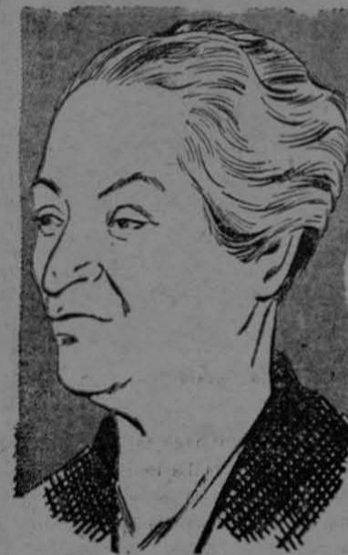
Gabriela Mistral

CIUDAD DE MEXICO.—La lenta extinción de Gabriela Mistral, la poetisa chilena, que obtuvo un Premio Nóbel de Literatura y que por espacio de varios años laboró en México, en materias de educación infantil durante el régimen del presidente Alvaro Obregón, motivó una oleada de manifestaciones de pesar en todos los países de la América.