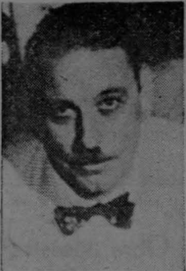
Luis Muñoz Marín

a la causa de la libertad y de la buena comprensión del Hemisferio.